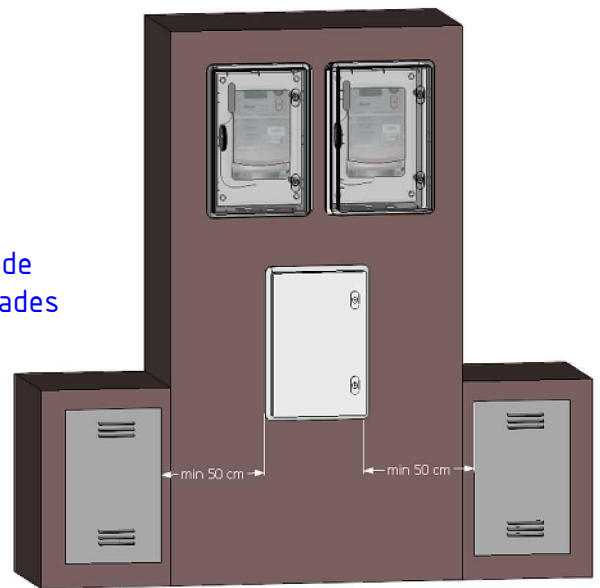
Distancia mínima de un pilar doble a instalaciones de gas